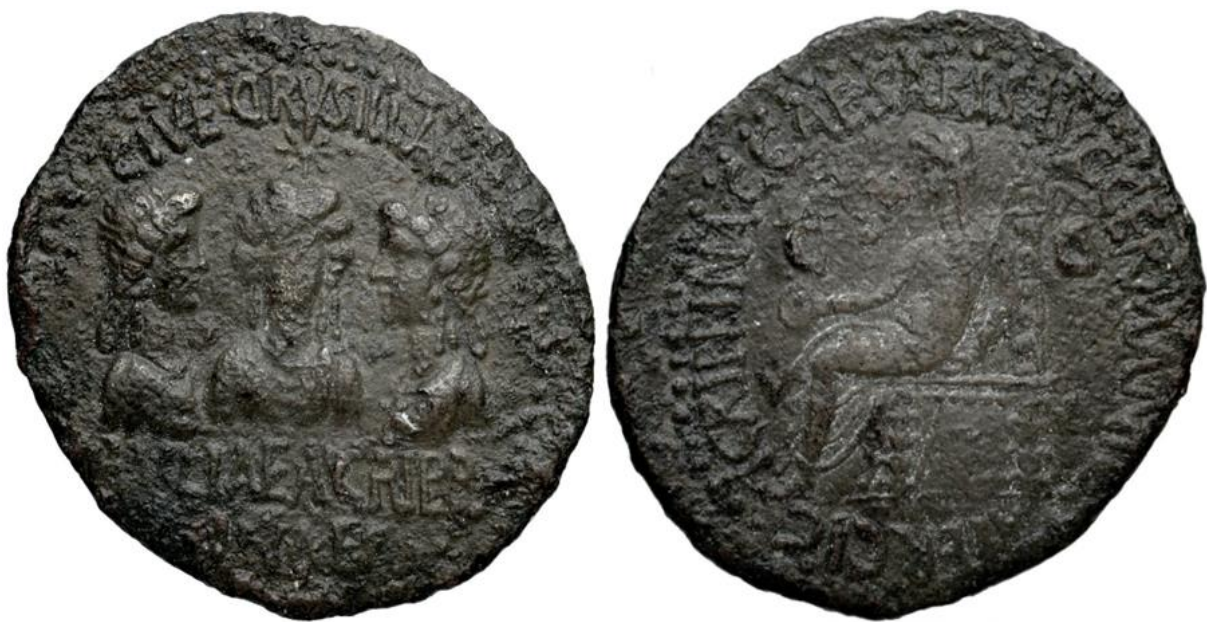
Рис. 1. Бронзовая монета с образами Юлии Друзиллы, Агриппины Младшей и Юлии Ливиллы. Отчеканена в Апамее Вифинской в 38 – 41 гг. н. э. Монетный тип: RPC I 2012. Экземпляр из собрания Отделения монет, медалей и древностей Национальной библиотеки Франции. Идентификатор: В 1005. Источник: URL: https://gallica.bnf.fr/ark:/12148/btv1b8561711g (дата обращения 25.05.2024)