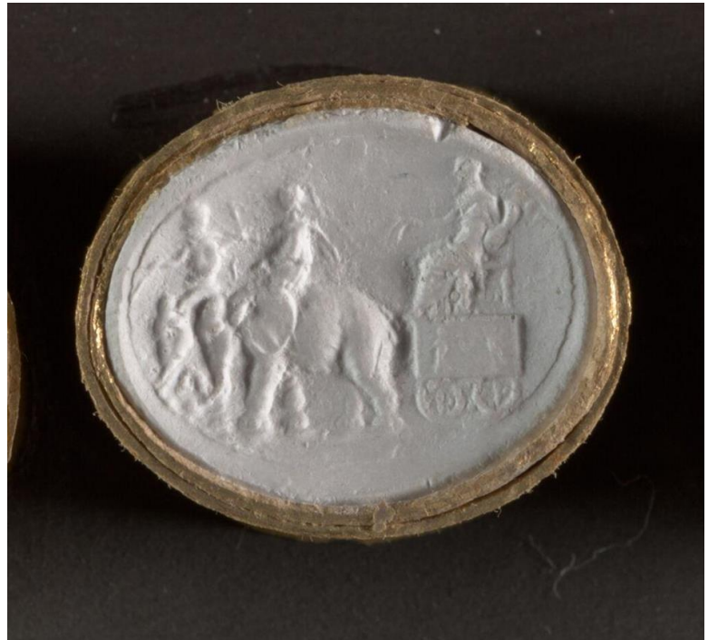
Рис. 3. Гемма с изображением Цереры, едущей на повозке, запряженной двумя слонами.

При Антонинах увеличивается как количество монет с изображениями императриц, в том числе отсылающих к апофеозу, так и разнообразие изображений на них: Марциану, Матидию и Плотину (сестра, племянница и жена императора Траяна соответственно), Фаустину Младшую и Фаустину Старшую изображают также с Дианой, Венерой, Этернитас (RIC III Marcus Aurelius 1710; RIC III Antoninus Pius 333; RIC III Antoninus Pius 345; RIC III Antoninus Pius 354; RIC III Antoninus Pius 387a (quinarius aureus); RIC III Antoninus Pius 380). Также укореняется еще один атрибут, впоследствии часто возникающий в иконографии божественных август, – колосья. Колосья являются устоявшимися символами богини Цереры (RIC I (second edition) Galba 326), ее атрибуты часто использовались в иконографии Ливии. Именно с колосьями она изображена на первой посвященной ей монете, выпущенной во время правления императора Клавдия (RIC I (second edition) Claudius 101) (рис. 1); также ее статуя в качестве богини плодородия с колосьями и рогом изобилия имеется в Лувре (рис. 5).