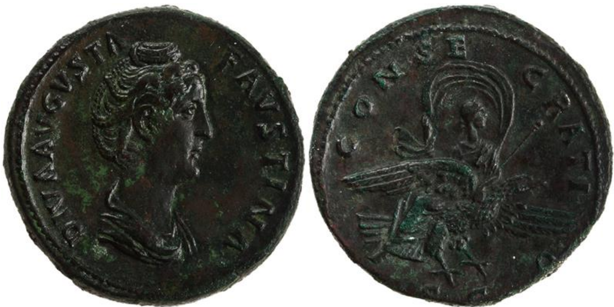
Рис. 2. Бронзовый сестерций с образом обожествленной Фаустины Старшей. Отчеканен в Риме в 141 г. н. э. Монетный тип: RIC III Antoninus Pius 1133a. Экземпляр из собрания Американского нумизматического общества. Идентификатор: 1963.79.2.

Изображения обожествленных женщин также создавались в рамках традиции, сформировавшейся в ходе изменения иконографии культа императора в соответствии с гендерными нормами того времени. Так, легенда CONSECRATIO также активно использовалась в чеканке с их изображениями. Несмотря на свое происхождение, традиция изображения женщин имеет несколько фундаментальных отличий от иконографии императора. Так, орел на реверсе заменялся павлином – символом апофеоза членов императорской семьи женского пола (RIC V Mariniana 5). При этом орел помимо связи с императором [15, р. 273] был символом римской государственности, павлин же имел другую семантику – он был символом богини Юноны [16, р. 196] (рис. 2). Также разнообразие изображений, используемых с данной легендой, у женщин в целом было гораздо более скудным.