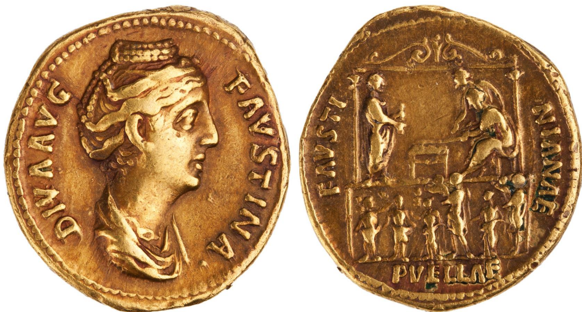
Рис. 6. Ауреус с образом обожевленной Фаустины Старшей. Отчеканен в Риме в 141 г. н. э.

В чеканке этой эпохи встречаются и нетипичные сюжеты. Так, на монетах божественной Фаустины Старшей на реверсах присутствуют сложные многофигурные сцены, изображающие императорскую династию. Подобные сюжеты можно разделить на два типа. Первый – это парное изображение Антонина Пия и Фаустины Старшей, держащихся за руки, и Конкордии (RIC III Antoninus Pius 402A). Второй – изображение августейшей семейной четы вместе с группой мужчин, женщин и девочек в здании с колоннами (RIC III Antoninus Pius 397) (рис. 6); эти монеты сопровождаются надписью PVELLAE FAVSTINIANAE (девочки Фаустины) – название благотворительной организации, созданной Марком Аврелием в честь своей покойной жены и помогавшей девочкам-сиротам [23, p. 71].