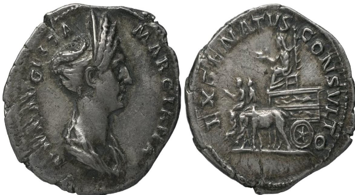
Рис. 4. Серебряный денарий с образом обожествленной Ульпии Марцианы. Отчеканен в Риме в 113 – 114 гг. н. э. Монетный тип: RIC II Trajan 747. Экземпляр из собрания Отделения монет, медалей и древностей Национальной библиотеки Франции. Идентификатор: IMP-3300. Источник: URL: https://gallica.bnf.fr/ark:/12148/btv1b10447576w (дата обращения 26.05.2024)