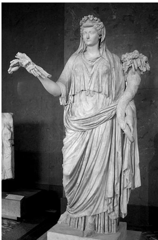
Рис. 5. Мраморная статуя Ливии Друзиллы с колосьями и рогом изобилия, I в. н. э. Музей Лувра, Париж