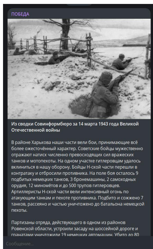
Рис. 4. Публикация в канале «Победа» от 14 марта 2025 г. [9]