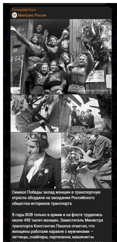
Рис. 3. Публикация в канале «80 лет Великой Победе» от 20 марта 2025 г. [11]