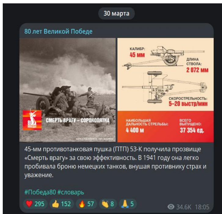
Рис. 2. Публикация в канале «80 лет Великой Победе» от 30 марта 2025 г. [12]

Помимо фотографий и картинок для иллюстрации к текстам прилагаются видеозаписи (отрывки фильмов, ссылки на сторонние ресурсы).